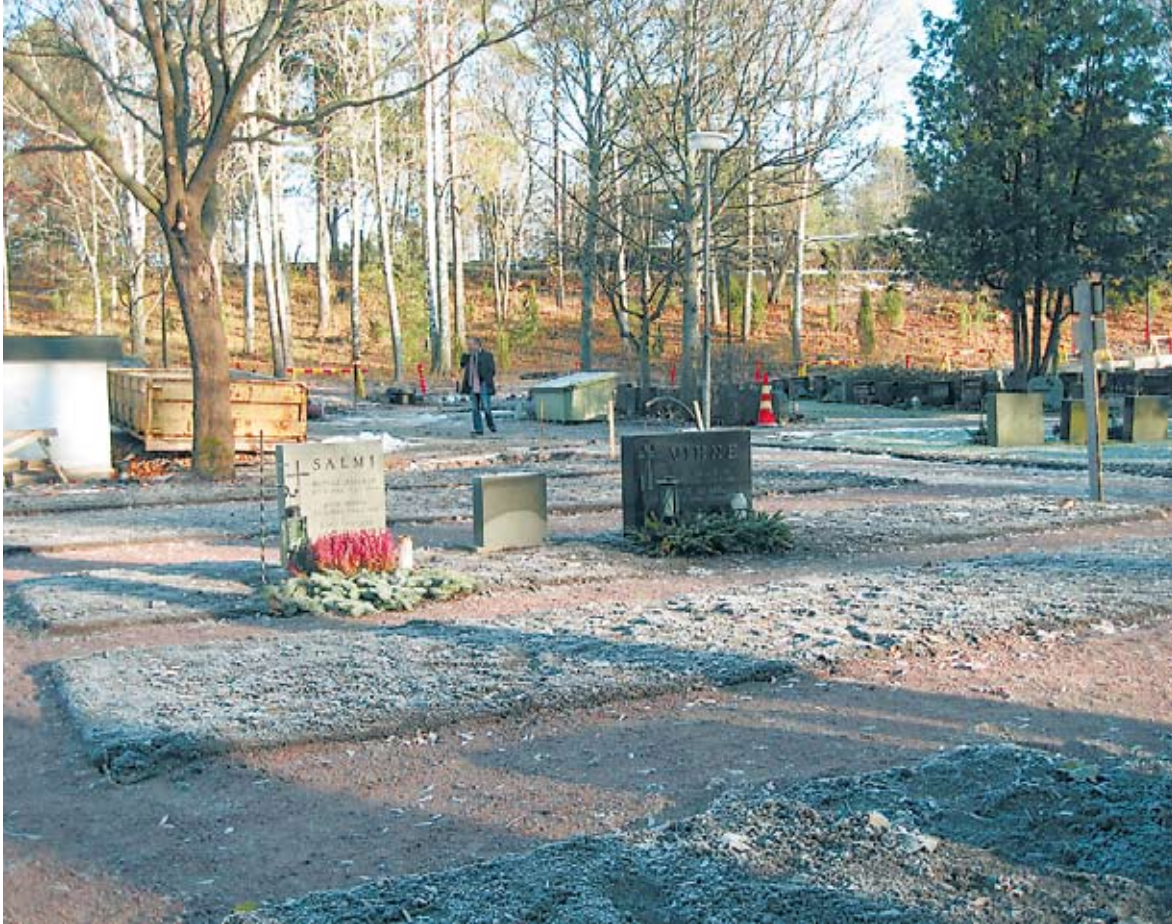
Näkymä uurnahautausmaalta marraskuussa 2006.

Naantalin seurakunta rakentaa kirkon hautausmaan yhteyteen uurnahautausmaata, johon tulee noin 550 uurnahautapaikkaa sekä muistolehto ja sirottelualue. Tässä yhteydessä seurakunta peruskorjaa myös koko kirkon hautausmaan ja hautausmaan huoltorakennuksen. Kirkon hautausmaalla ei ole enää uusia arkkuhauta- paikkoja.