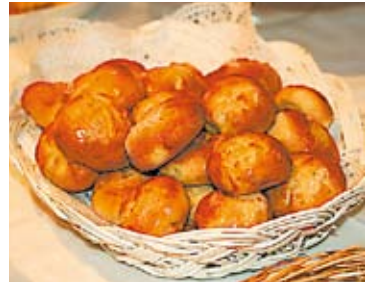
Sirpan pullat ovat herkullisia.