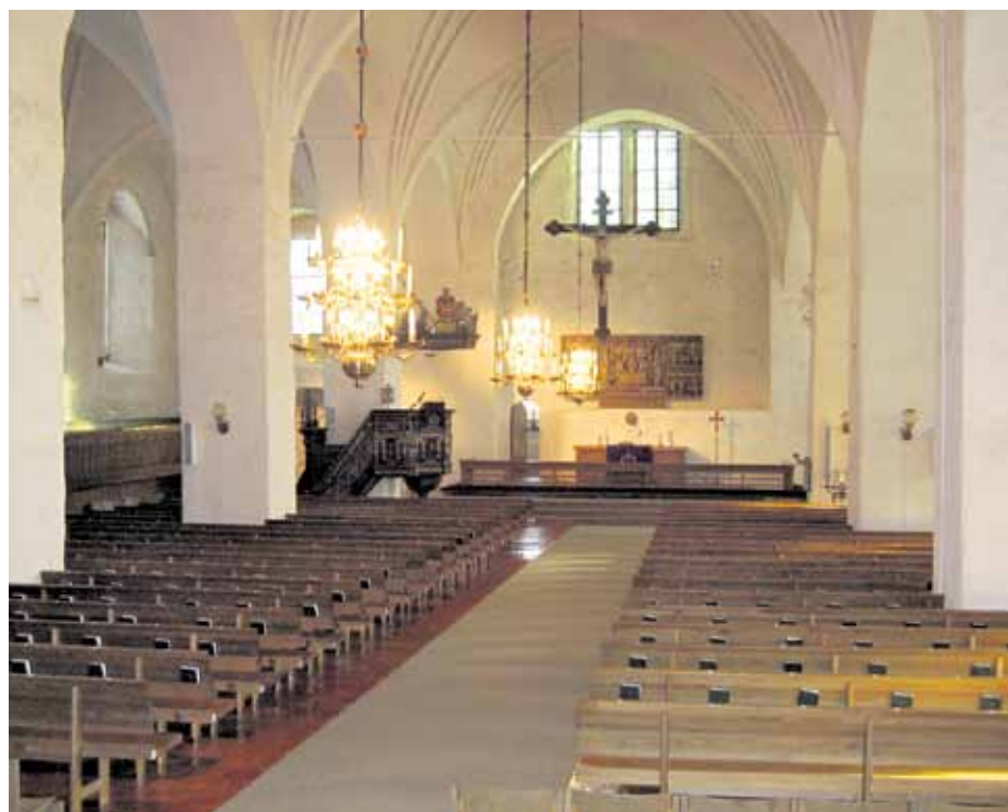
Kirkkosali on ensisijaisesti kirkkotila ja kaikki muu on sille alisteista. Enimmäishenkilömääräksi on määritelty 850.