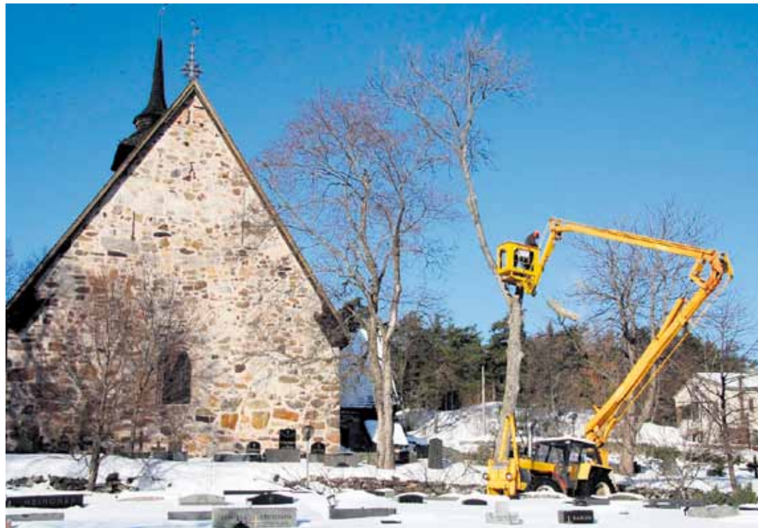
Rymättylän kirkon ympäriltä kaadettiin maaliskuun alussa puita. Muun muassa aikoinaan istutettu kuusirivi poistettiin. Suurin osa kaadetuista puista oli sairaita. Näkymä avartui ja kirkko näkyy paremmin. Raivaustyötä valokuvasi Matti Rinne.