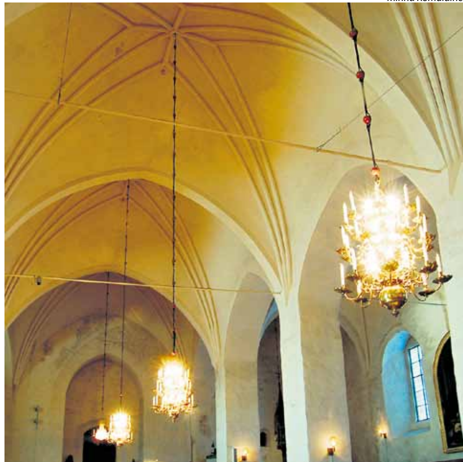
Holvit maalataan perinteisellä kalkkimaalilla.