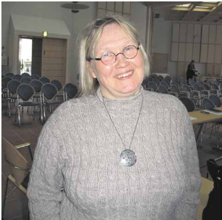
Naantalinkirkon peruskorjauksen on suunnitellut arkkitehti Virpi Tervonen.