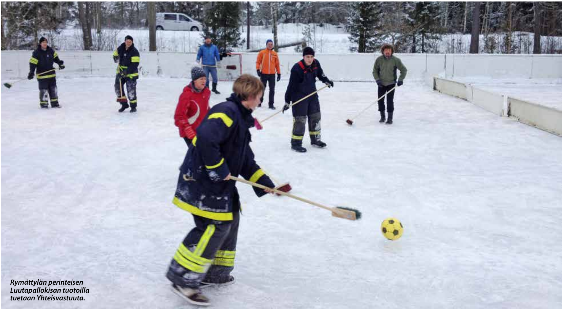
Rymättylän perinteisen Luutapallokisan tuotoilla tuetaan Yhteisvastuuta.